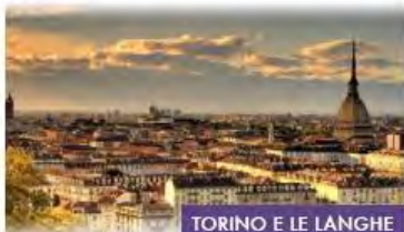
TORINO E LE LANGHE